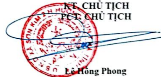
Lê Hồng Phong